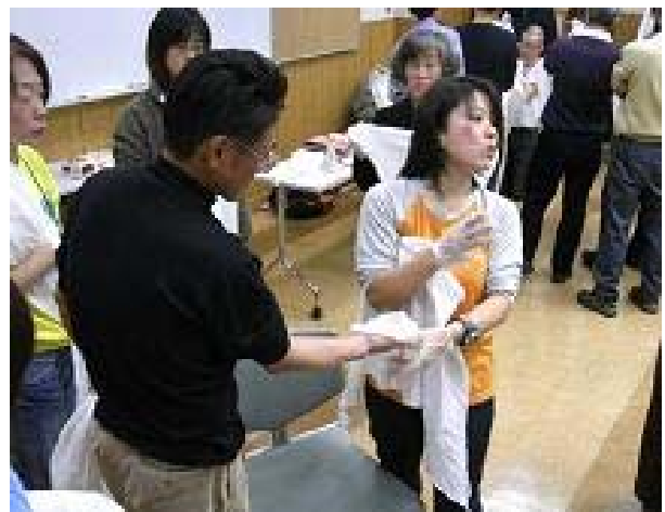
2008年ファーストエイド講習の様子