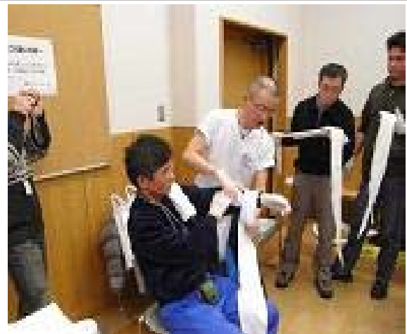
2008年ファーストエイド講習の様子